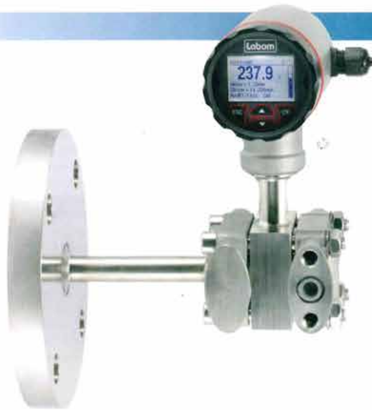
Labom hat die Bediensoftware des Pascal Ci4 konsequent für die hydrostatische Füllstandsmessung optimiert

Seminar mit dem Titel "Managing Corrosion with Teflon Fluoropolymer Resins" erläutert die Vorteile von Korrosionsschutzlösungen aus Teflon. Im Fokus des Seminars stehen verbesserte Dichtungssysteme mit reduzierten Wartungsintervallen, konkrete Fallbeispiele für Auskleidungen oder Lösun-